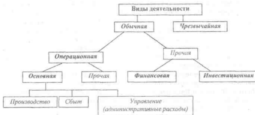
Рис. 4. Виды деятельности предприятия, классифицируемые по источникам финансовых результатов

Уточнению подлежат и другие термины, применяемые в характеристиках указанных выше видов деятельности: